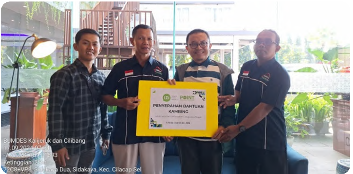
BUMDES Kalijeruk dan Cilibang 17.09.2024 07:44 -772731184-1693 Ketinggian: 25m 72C8+VP8, Sidakaya Dua, Sidakaya, Kec. Cilacap Sel