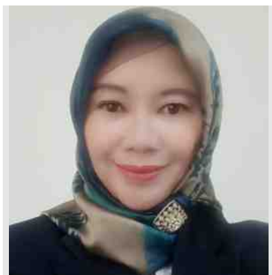
Astridina, SSos, MM

Asisten Direktur Pengelolaan Kebersihan Lingkungan Kampus, DPSPL